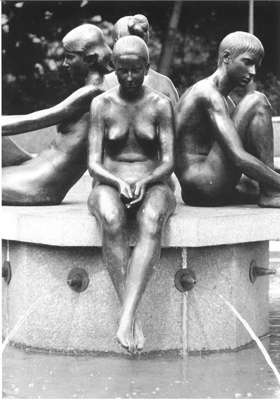
BRUNNEN AN DER KARL- LIEBKNECHT- STRASSE, BERLIN, MITTE 1985