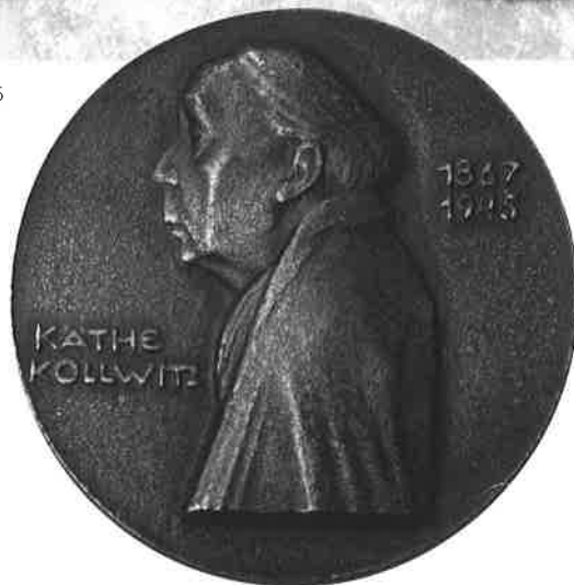
KÄTHE KOLLWITZ I, 1961