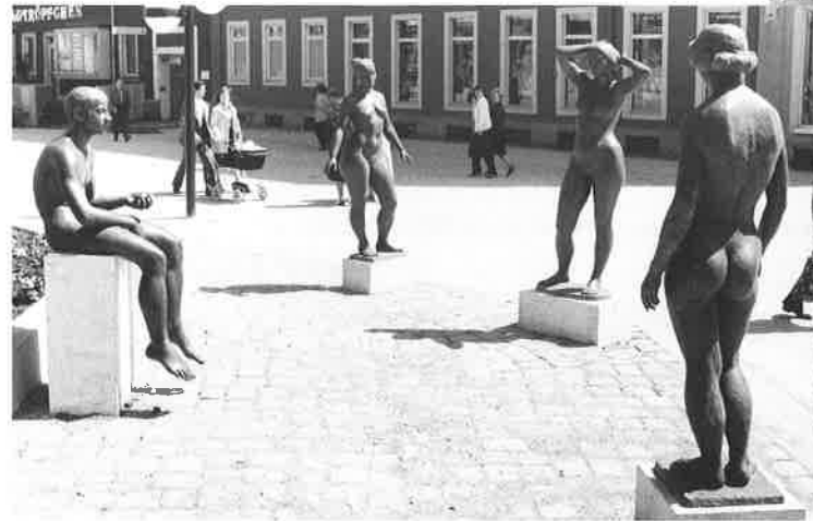
URTEIL DES PARIS, CHEMNITZ

Fitzenreiter's Menschen sind auf dem Sprung, oft reagieren sie umwerfend heftig, laufen ohne viel zu fragen auf ein Ziel los. Wie sein lebenssprühender "Torwart", eine kleine Bronze von 1965, werfen sich seine Gestalten in das, was sie als Aufgabe ihres Daseins erkannt haben. Eine unermüdliche Energie treibt sie vorwärts, fast keiner, der sich nicht rührt, der bleiben will, was und wo er ist. Die Weit- und Hochspringer, Sprinter, Turner, Schwimmer wollen häufig von Statik und Körpervolumen wenig wissen: Dynamik ist alles, nicht selten eine Gestik des Hals über Kopf, atemlos, knapp an der Gefahr vorbei, aus der Bahn geschleudert zu werden. In Reliefs herrscht ein ruhigerer Erzählton; der Linienrhythmus verliert das Eckige und Flattrige; die Leiblichkeit steht fülliger im Fleisch.