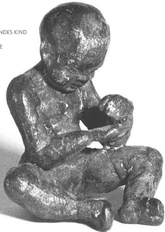
SPIELENDES KIND 1987 BRONZE 7 CM

1932 Geboren am 17. September in Salza bei Nordhausen/Thüringen 1951-52 Nach dem Abitur Lehre als Steinmetz in Halle/Saale 1952-58 Studium der Bildhauerei am Institut für künstlerische Werkgestaltung in Halle (Kunsthochschule Burg Giebichenstein) bei Gustav Weidanz und Gerhard Lichtenfeld. Beschäftigung mit dem Bronzeguß 1958-61 Meisterschüler an der Deutschen Akademie der Künste zu Berlin bei Heinrich Drake. Seitdem freischaffend in Berlin 1959 Gold- und Silbermedaille auf der Internationalen Ausstellung junger Künstler in Wien 1962 Erste Einzelausstellung (Kabinett der Nationalgalerie Berlin). Beteiligt an den Ausstellungen "Junge Künstler" (Akademie der Künste) und "Deutsche Bildnisse" (Nationalgalerie) 1964 Will-Lammert-Preis der Akademie der Künste 1965 Kunstpreis des Deutschen Turn- und Sportbundes. Ausstellung im Kunstkabinett am Institut für Lehrerweiterbildung, Berlin-Weißensee. Beteiligt an den Biennalen der Ostseeländer, Rostock 1968-74 Ausstellung in Stockholm. Beteiligt an Ausstellungen mit Bild- hauerzeichnungen, Kleinplastik und Medaillen in Halle, Budapest und Gotha