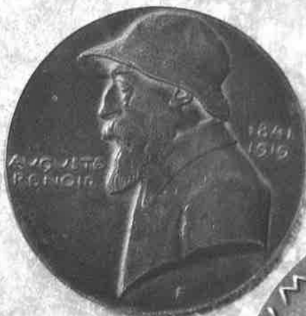
AUGUSTE RENOIR, 1990