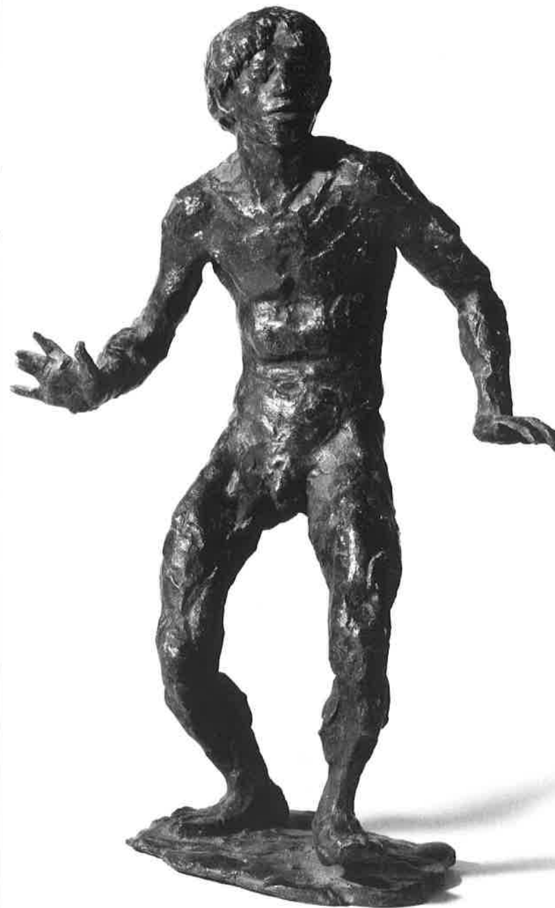
DER TÄNZER, 1971, BRONZE, HÖHE 33 CM