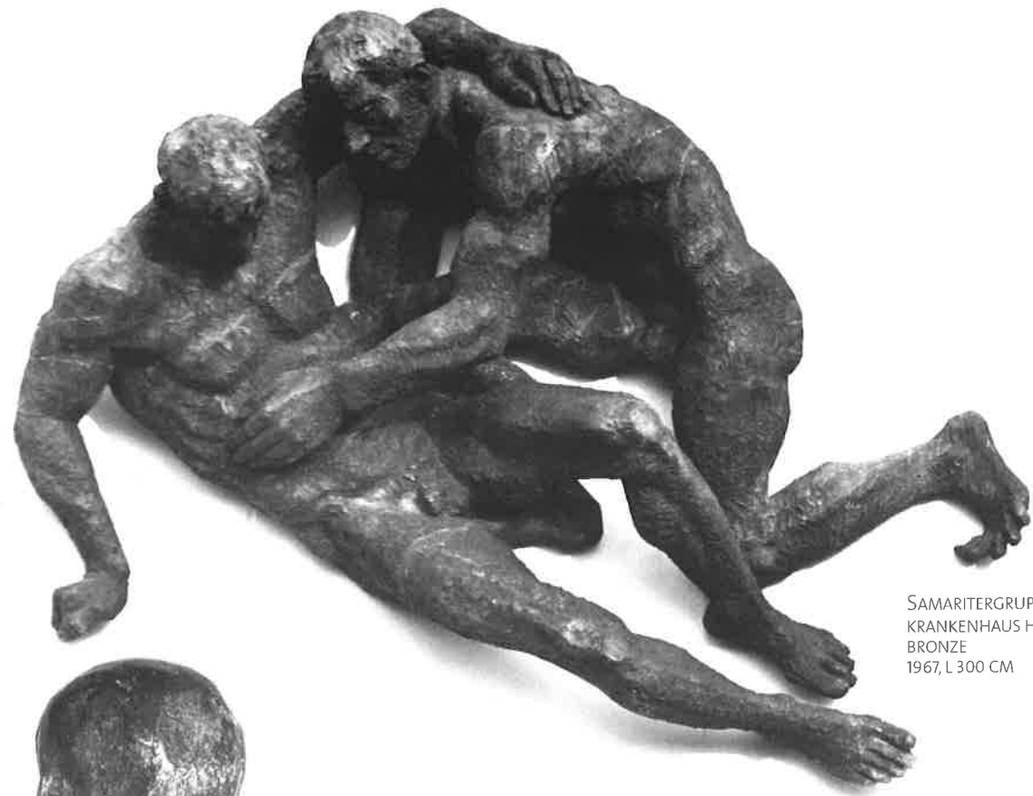
SAMARITERGRUPPE KRANKENHAUS HOYERSWERDA BRONZE 1967, L 300 CM