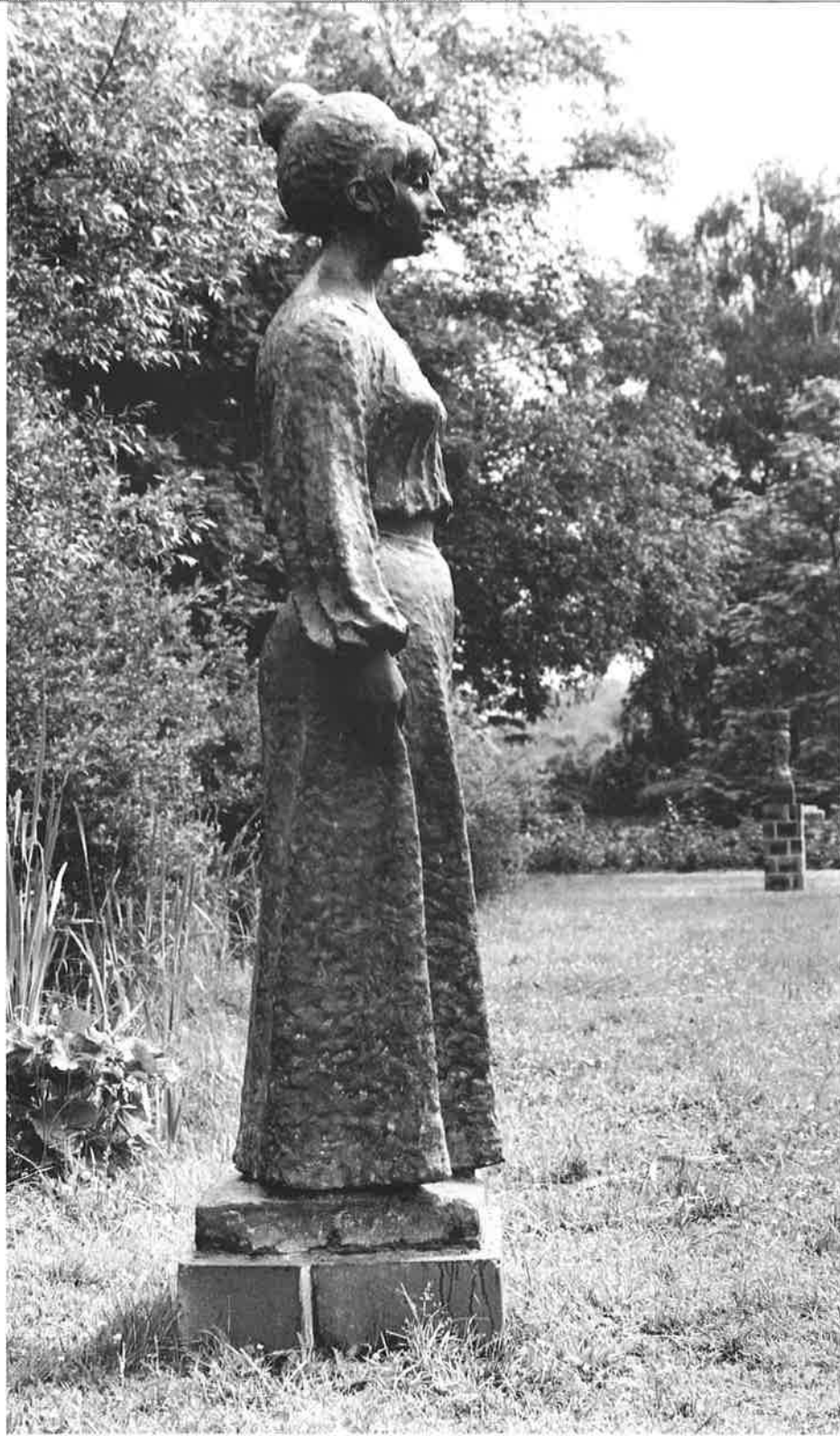
STEHENDE, 1974 BRONZE H 180 CM