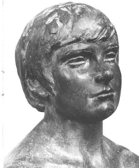
KOPF S., 1988