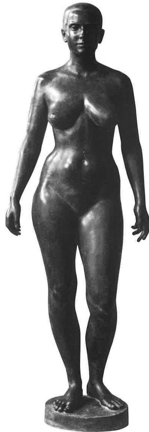
STEHENDES MÄDCHEN, 1989 BRONZE H 167 CM